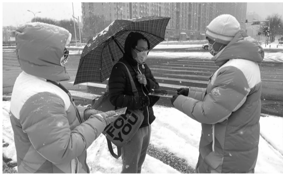
蓝城兄弟志愿者为居民发放宣传手册

“成为一名北京冬奥会的城市志愿者是一种荣耀和幸运……”据悉,为助力北京冬(残)奥会,自1月15日以来,双井街道辖区单位北京蓝城兄弟信息技术有限公司在公司内部招募了80名党员、团员和青年职工骨干,作为志愿者代表参与冬奥城市志愿服务。蓝城兄弟志愿者服务的站点是主媒体村西,也是距离冬奥场馆最近的站点,承担着路线指引、冬奥氛围营造等任务。