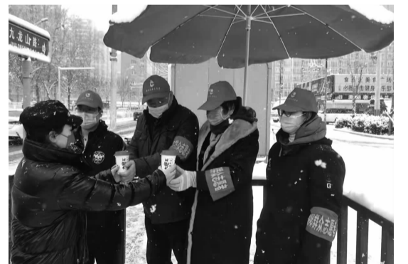
辖区商户为志愿者送上热饮

“大家快来拿扫把、工具,一起清理积雪啦。”虎年初雪的到来,为正在召开的北京冬奥会增添了浓厚的氛围,但下雪可能会给居民的出行造成不便。为防止降雪对市民出行和交通造成不利影响,确保群众正常的生产生活秩序,双井街道高度重视、广泛动员,